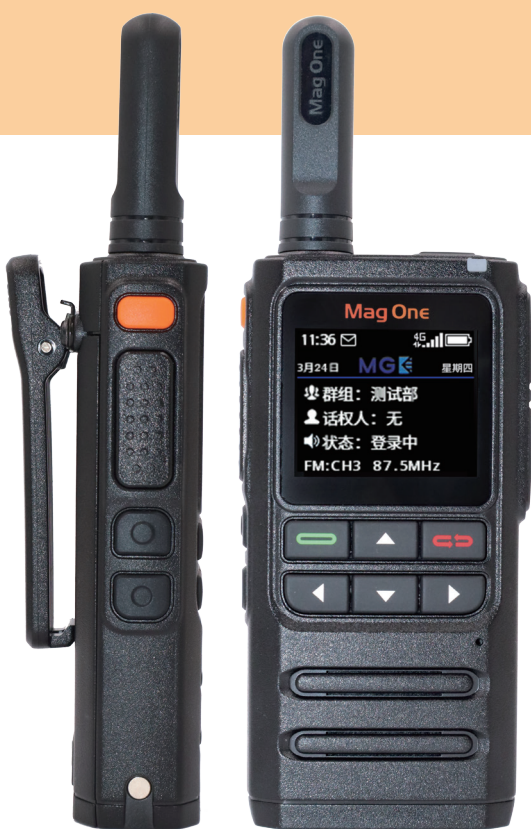
Mag One H36

通过中国通信产品进网要求认证 (China Type Approval)、SAR 辐射规范要求的测试以及国家 CQC/CCC 安全合规认证，达到了高规格的使用安全等级。作为一家秉持企业责任感的全球企业，摩托罗拉系统出品的 Mag One H36 除了符合中国市场的 CMMII 的环保要求外，还满足了更为严苛的摩托罗拉系统企业内部环保要求。