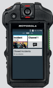
Mikrofonogłośnik wideo Si500

Kamery z naszej oferty bezproblemowo współpracują z systemem CommandCentral Vault. Zdjęcia, pliki dźwiękowe i wideo można bezpiecznie przesyłać oraz łatwo nimi zarządzać wraz z pozostałymi dowodami cyfrowymi.