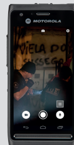
Aplikacja foto/video Capture App

Więcej informacji o platformie CommandCentral Vault, wykorzystaniu usług w chmurze i ekosystemie dowodów cyfrowych znajdziesz na stronie motorolasolutions.com/digitalevidence