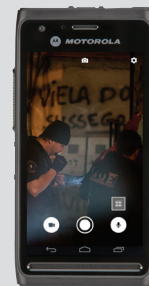
Application de capture pour mobile

Pour plus d'informations sur CommandCentral Vault, l'utilisation du Cloud et sur notre écosystème de preuves numériques, veuillez consulter le site motorolasolutions.com/digitalevidence