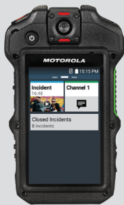
Caméra corporelle Si500

Notre gamme de caméras est conçue pour fonctionner directement avec CommandCentral Vault. Tous les fichiers image, audio et vidéo peuvent être téléchargés de manière sécurisée dans CommandCentral Vault où ils peuvent être gérés avec le reste de vos preuves numériques.