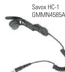
Savox HC-1 GMMN4585A

Savox HC-1 är en kompakt hjälmkommunikationsenhet för räddningstjänstpersonal i riskfyllda miljöer. Den monteras enkelt i de flesta hjälmtyper och ger tydlig handsfree-kommunikation, vilket gör den idealisk för räddningstjänstpersonal.