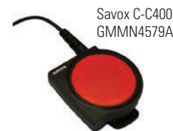
Savox C-C400 GMMN4579A

Komplettera lösningen med Savox C-C400 kontrollenhet som möjliggör användning av din radio i tuffa miljöer. Utformad för de mest extrema miljöer säkerställer den stora PTT-knappen överföring även när den används under utrustning och skyddskläder.