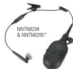
NNTN8294 & NNTN8295*

Bluetooth 2.1 -ljud är inbäddat i radion och möjliggör snabb och säker parning med ett stort antal Bluetooth-tillbehör. Motorola Bluetooth-tillbehör är enkla att fästa och para och förbättrar prestandan och säkerheten oavsett var du arbetar. Poliserna kan prata diskret, röra sig utan sladdar och använda sin radio som aldrig förr.