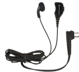
Ohrstöpsel mit integriertem Mikrofon und Sprechaste

Die Funkgeräte der Serie XT600d sind mit dem Zubehör für die Serie XT400 kompatibel (außer Ansteckhalterung und Ledertasche).