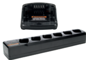
Einzel- und Mehrfachladestationen