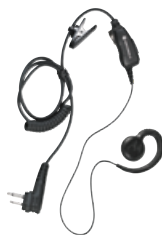
Schwenkbarer Ohrhörer mit integriertem Mikrofon und Sprechaste