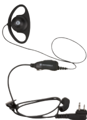
D-Ohrhörer mit integriertem Mikrofon und Sprechaste