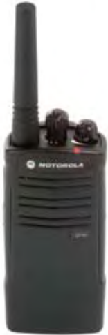
Modelo EP150 UHF

Diseñado para satisfacer las necesidades de la industria de la construcción.