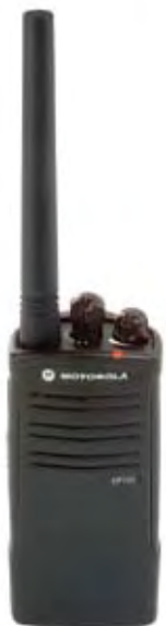
Modelo EP150 VHF

Con un peso de solo 244 g (8.6 onzas), el EP150 es cómodo para usar durante todo el día. Además, la interfaz del usuario simplifica y facilita el uso del radio con poca o ninguna capacitación.