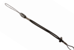
Pasek na nadgarstek