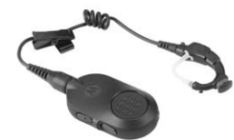
Bezprzewodowa słuchawka do zadań specjalnych

„Gdy pierwszy raz zobaczyłem Serię SL MOTOTRBO pomyślałem, że to telefon komórkowy, a nie radiotelefon. Urządzenie posiada wszystkie funkcje radiotelefonu, profesjonalny, a zarazem dyskretny wygląd, pasujący do każdego ubioru.“