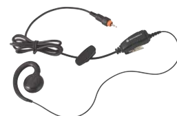
Ørepropp med innebygd "trykk-for-å-snakke"-knapp

Dette revolusjonerende og rene designet sørger for rask lading av din Motorola CLP. En multienhetslader lar deg enkelt lade opptil seks Motorola CLP-er samtidig. Laderen er designet med en baklomme til oppbevaring av øreproppene mens enheten lades, og kan monteres på veggen dersom det er lite plass.