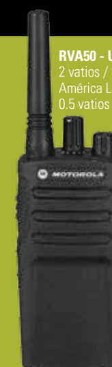
RVA50 - UHF 2 vatios / 8 canales América Latina 0.5 vatios (Colombia)

ELIJA EL RADIO RVA50 ADECUADO PARA SATISFACER LAS NECESIDADES ESPECÍFICAS DE SU EMPRESA