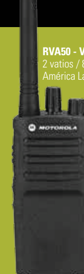
RVA50 - VHF 2 vatios / 8 canales América Latina