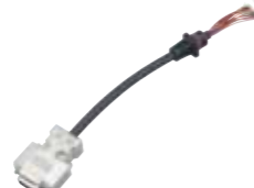
データ通信ケーブル CT-147