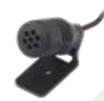
サンバイザーマイク* GMMN4065