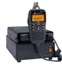
直流安定化電源 FP-33 ※本体・マイク含まず