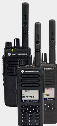
MOTOTRBO serie DP4000e